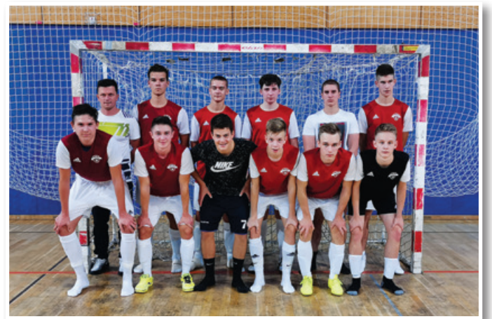
Mlada ekipa Benedikt Slovenske gorice se je na pokalnem članskem futsal tekmovanju MNZ Maribor predstavila v dobri luči.

Miklavž TBS Team24, ki so jo dobili slednji in tako osvojili svoj prvi naslov pokalnih zmagovalec MNZ Maribor v futsalu ter si pridobili vstopnico v nadaljevanje tekmovanja v slovenskem futsal pokalu.