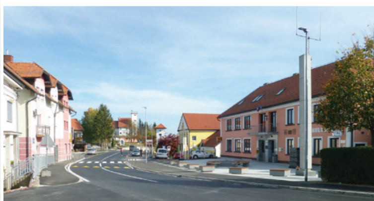
Obnovljeno središče Cerkvjenjaka je dobilo obliko trga.