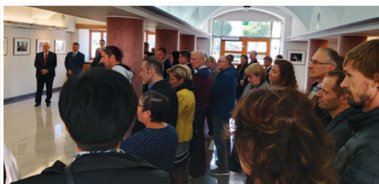
Odprli so prenovljene prostore Upravne enote Lenart.