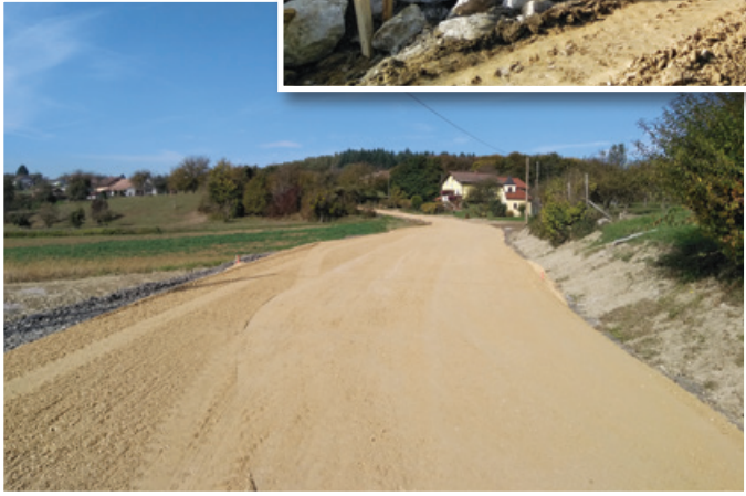
Obnova in širitev ceste v Zg. Voličini