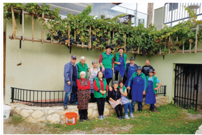
Berači ob potomki najstarejše trte

Prav tako smo se člani društva vinogradnikov, članice društva kmečkih žena in deklet ter člani turističnega društva 5. 10. odpravili na sedaj že tradicionalno vožnjo po Vinski cesti v sosednjo Avstrijo (Weinstrasse). Spetoma smo se ustavili v kraju Gomilica (Ga-