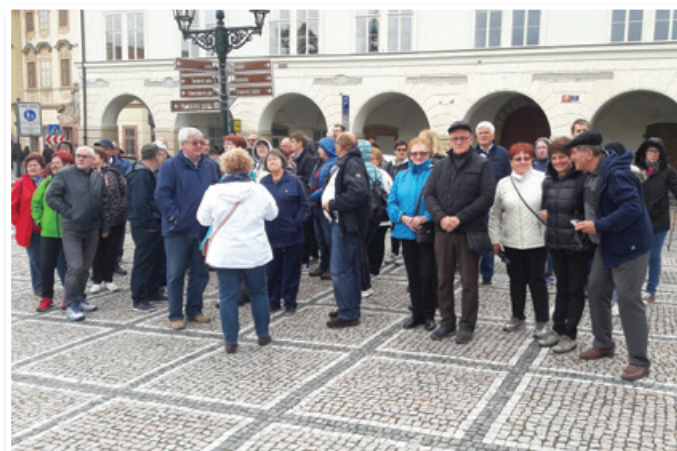
Invalidi MDI Lenart se radi udeležujejo izletov, tokrat so se potepali po Pragi.

Člani izvršnega odbora in poverjeniki so pri-